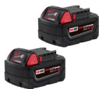
SET DE BATERÍAS 18V