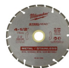
DISCO DE CORTE