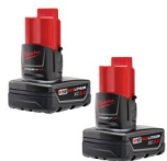
SET DE BATERÍAS 12V 3.0