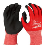
GUANTES ANTI CORTE N1